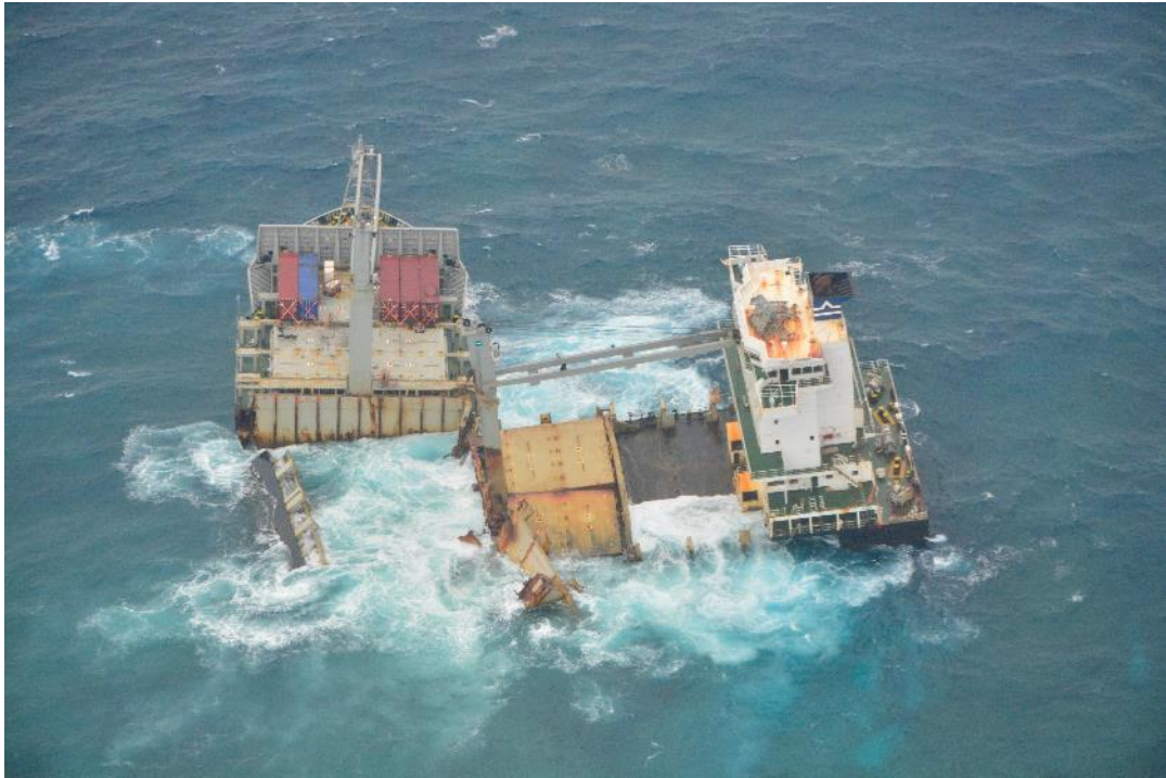
Photo prise le 17/05/2018 par un appareil de surveillance maritime « Gardian » de la Marine Nationale. (Crédits : Forces Armées de la Nouvelle-Calédonie).