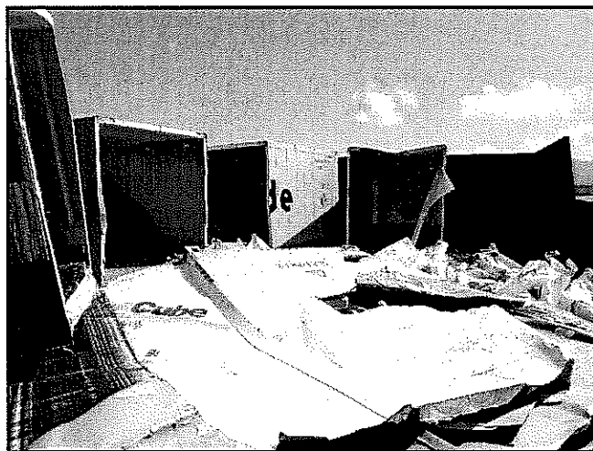
Plusieurs morceaux de conteneurs réfrigérés ayant été évacués du Kea Trader cette semaine.