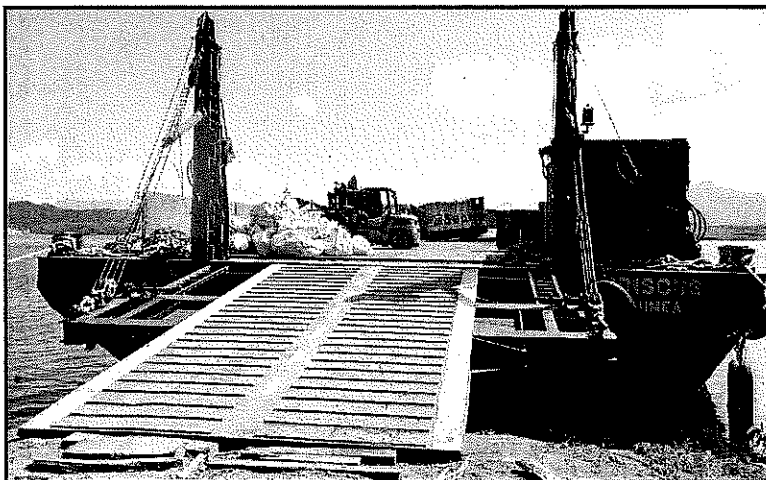
La barge Hibiscus au port autonome de Nouméa, en cours de déchargement.